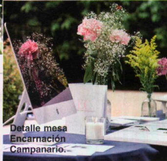
Detalle mesa Encarnación Campanario.