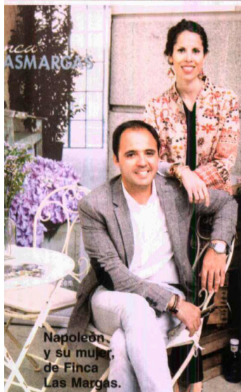
Napoleón y su mujer, de Finca Las Margas.