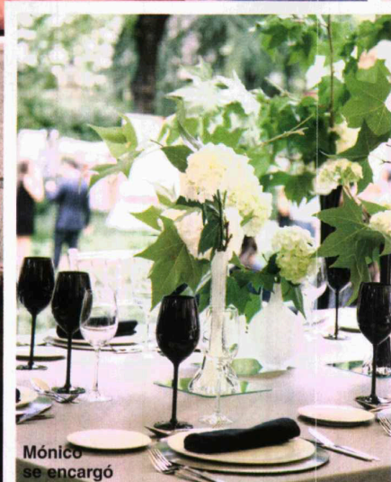
Mónico se encargó del catering.