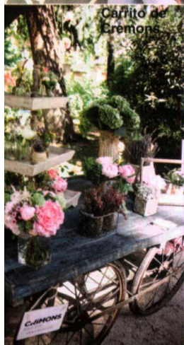
Carrito de Cremons.