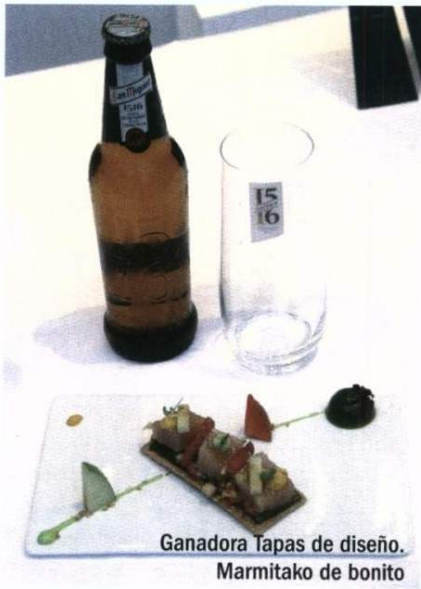
Ganadora Tapas de diseño. Marmiteko de bonito

Los pasados 27, 28 y 29 de enero se celebró la XII edición de la Cumbre Internacional de Gastronomía Madrid Fusión en el Palacio Municipal de Congresos de Madrid, en el Campo de las Naciones. En esta edición estuvieron presentes más de cien chefs a nivel nacional e internacional, 500 periodistas de todo el mundo, 150 empresas del sector, 1.000 congresistas y más de 2.500 visitantes diarios.