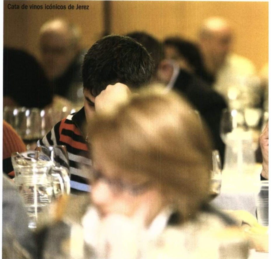
Cata de vinos icónicos de Jerez

La nueva edición de Madrid Fusión 2014 acogió por primera vez dos importantes congresos en uno solo. Por las mañanas, Madrid Fusión mostró la vanguardia de la gastronomía mundial, bajo el lema Comer en la ciudad; y por las tardes, Saborea España trajo lo mejor de la cocina tradicional española. Esto permitió que toda la actualidad de la cocina mundial se concentrara en dos escenarios y en 17 talleres magistrales que permitieron interactuar con los mejores cocineros. La cocina urbana fue uno de los focos de in-