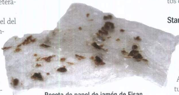
Receta de papel de jamón de Fisan

Algunos de los productos que más éxito tuvieron fueron los langostinos ecológicos