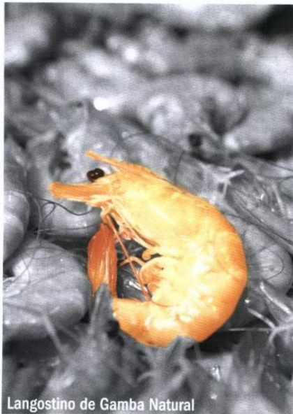
Langostino de Gamba Natural