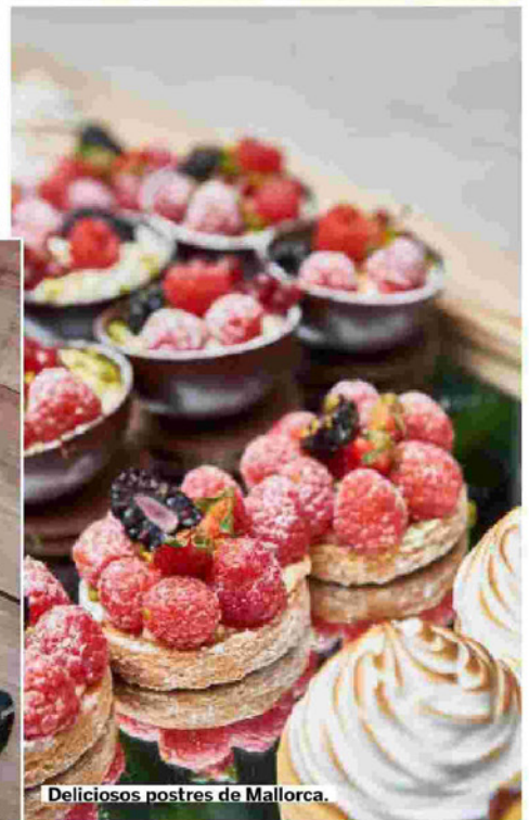
Deliciosos postres de Mallorca.