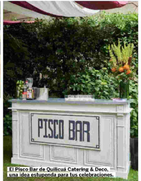
El Pisco Bar de Quilicúa Catering & Deco, una idea estupenda para tus celebraciones.