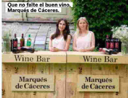
Que no falte el buen vino. Marqués de Cáceres.