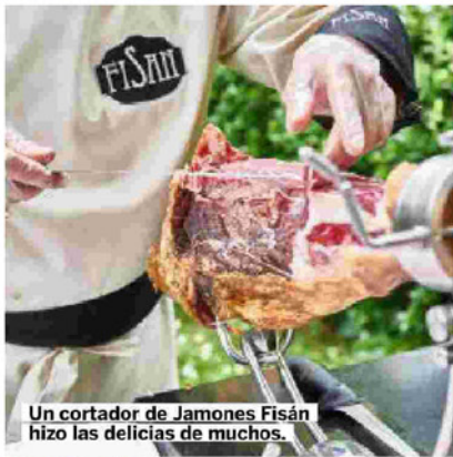
Un cortador de Jamones Fisán hizo las delicias de muchos.