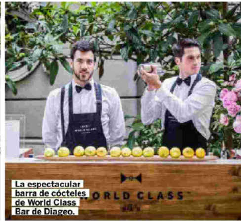
La espectacular barra de cócteles de World Class Bar de Diageo.