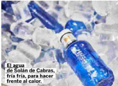
El agua de Solán de Cabras, fría fría, para hacer frente al calor.