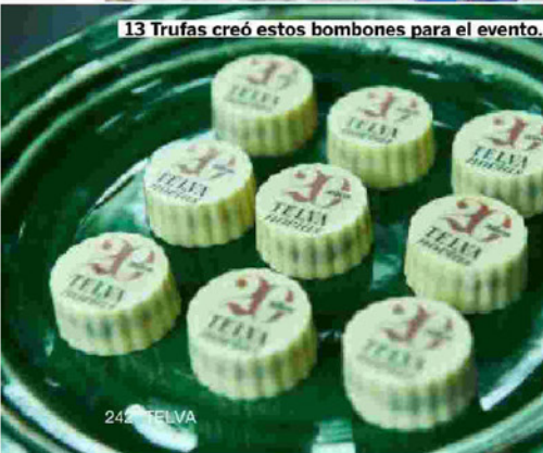
13 Trufas creó estos bombones para el evento.