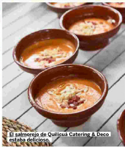
El salmorejo de Quilicúa Catering & Deco estaba delicioso.