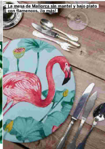
La mesa de Mallorca sin mantel y bajo plato con flamencos, ¡lo más!