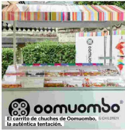
oomuombo El carrito de chuches de Oomuombo, © CHILDREY la auténtica tentación.