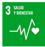
ODS 3 Salud y bienestar

[3-2] De esta forma, los ODS identificados como materiales son: