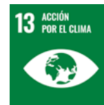
ODS 13 Acción por el clima

Para determinar los contenidos reportados en esta Memoria hemos tomado como referencia estos ODS prioritarios.