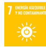
ODS 7 Energía asequible y no contaminante