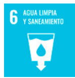
ODS 6 Agua limpia y saneamiento